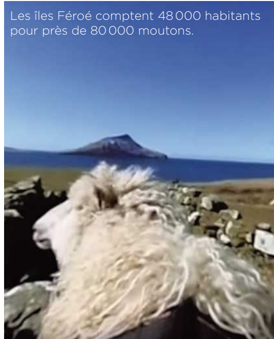
Capture d'écran YouTube

Les îles Féroé comptent 48 000 habitants pour près de 80 000 moutons.