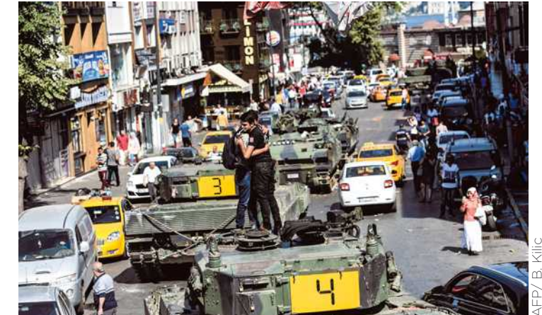
Des partisans d'Erdogan se réjouissent de l'échec du putsch.

Échec d'un coup d'État militaire contre le Président