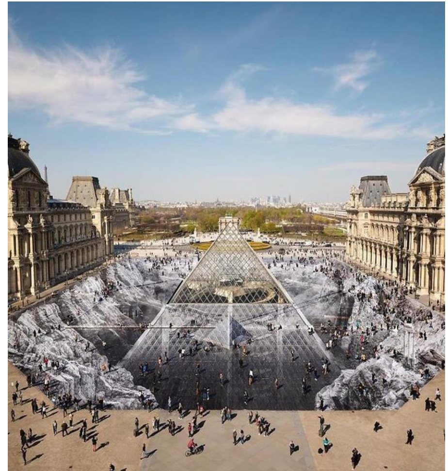
JR, Le secret de la Grande Pyramide , installation participative du 26 au 31 mars 2019, collage photographique, 17 000 m 2 dans la Cour Napoléon, auquel 400 volontaires ont contribué. Pyramide du Louvre, Paris, France.