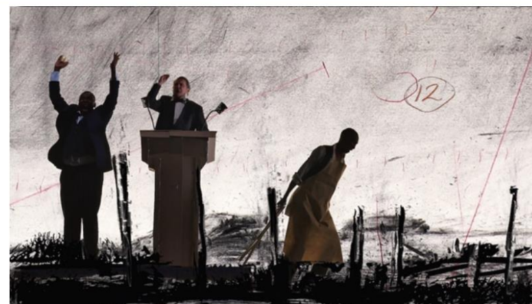
William KENTRIDGE, More Sweetly Play the Dance (Jouer la danse plus doucement) , 2015, dimensions variables, installation vidéo 8 canaux haute définition, 15 min, avec 4 porte-voix. Musée des beaux-arts du Canada, Ottawa, Canada. Vue d'installation à la galerie Marian Goodman, New York, 2016, États-Unis. Vue d'ensemble et détails.