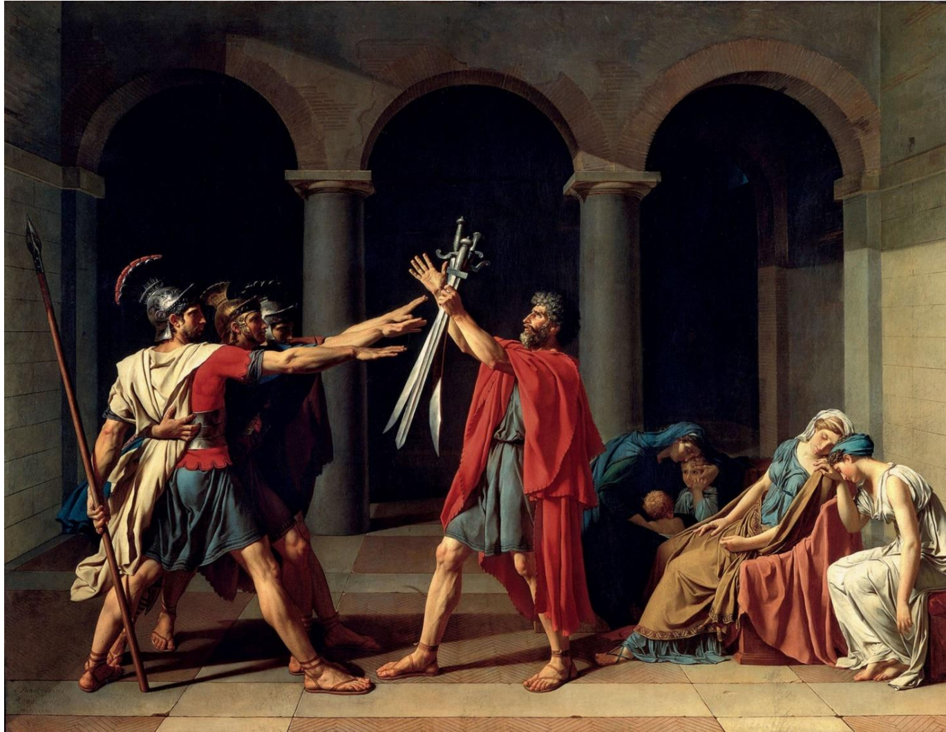
Jacques-Louis DAVID, Le Serment des Horaces , 1784, huile sur toile, 3,85 x 4,25 m. Musée du Louvre, Paris, France.

Le tableau présente les Horaces , héros de la Rome Antique, prêtant serment avant d'aller combattre.