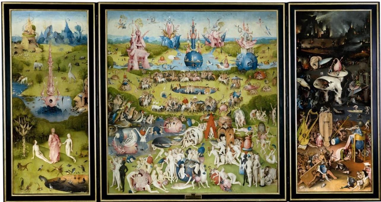
Jérôme BOSCH, Le Jardin des délices , 1494-1505, panneau central : 185,8 x 172,5 cm, panneaux latéraux : 185,5 x 76,5 cm chaque, huile sur bois. Musée du Prado, Madrid, Espagne.

Image supérieure : La Création du monde , triptyque fermé.