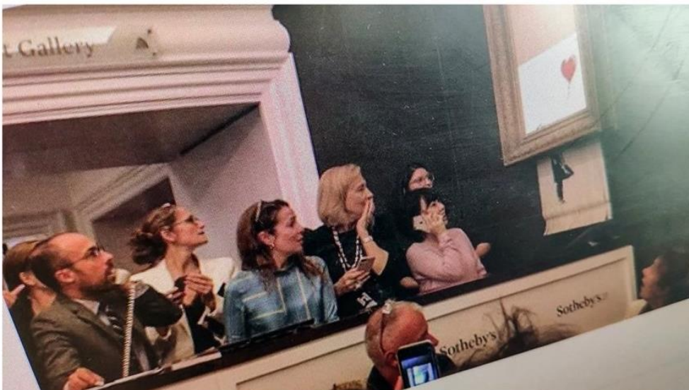
Image du compte Instagram de Banksy montrant la destruction d'une de ses oeuvres lors d'une vente aux enchères à Londres, le 5 octobre dernier.

CHRONIQUE. L'artiste Banksy a sans doute voulu dénoncer les excès de l'argent avec son tableau autodéchirant. C'est raté : ledit tableau vaut encore plus cher. Mais son message le plus important est ailleurs.