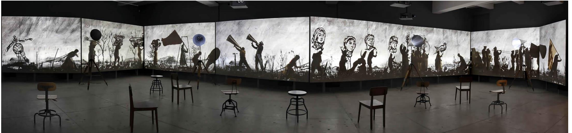
William KENTRIDGE, More Sweetly Play the Dance (Jouer la danse plus doucement) , 2015, dimensions variables, installation vidéo 8 canaux haute définition, 15 min, avec 4 porte-voix. Musée des beaux-arts du Canada, Ottawa, Canada. Vue d'installation à la galerie Marian Goodman, New York, 2016, États-Unis.