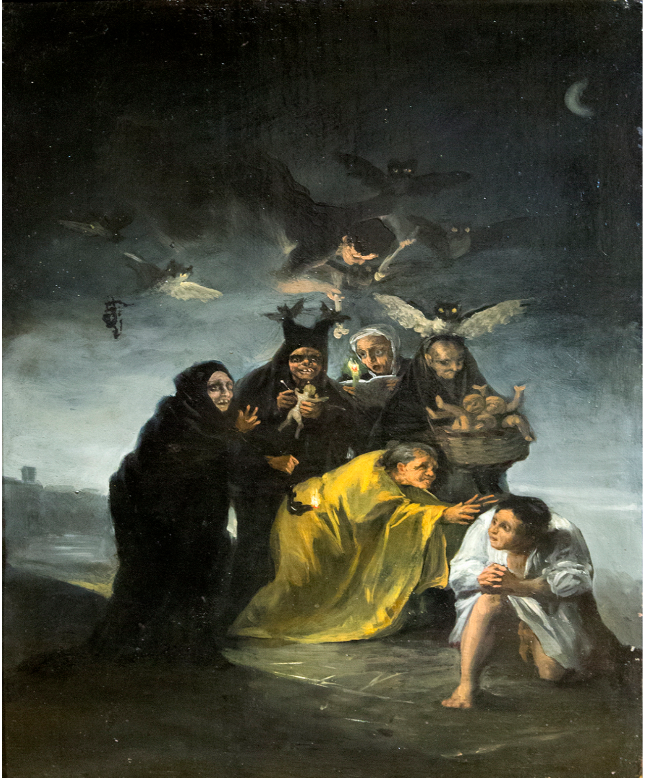
Francisco de Goya y Lucientes (pintor español), El Conjuero 1 o Las brujas , 1798.