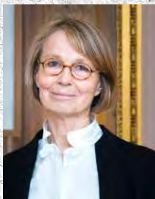
Françoise Nyssen, Ministre de la Culture