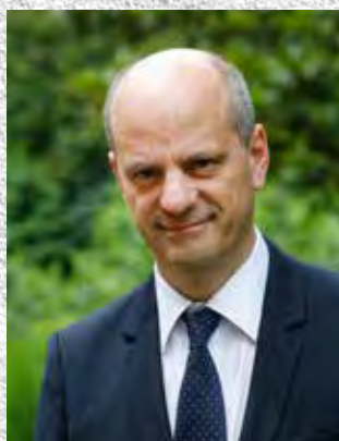
Jean-Michel Blanquer, Ministre de l'Éducation nationale