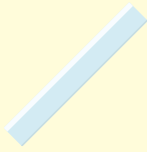
1 règle plate