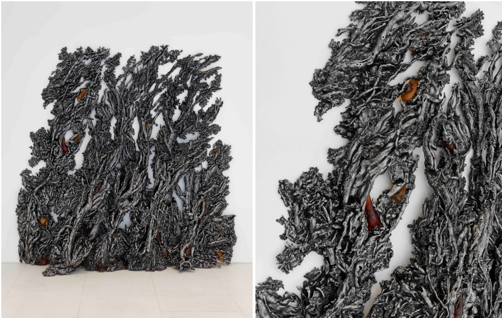
Cristina IGLESIAS, Entwined VIII (Entrelacés VIII) , 2022, aluminium et verre, H : 260 cm x L : 262 cm x I : 35 cm. Galerie Gagosian, Londres, Royaume-Uni.