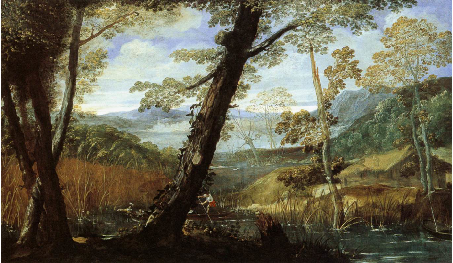
Annibal CARRACHE, Paysage fluvial , 1590, huile sur toile, 88,3 x 148,1 cm. National Gallery of Art (Galerie nationale d'art), Washington D.C., États-Unis.