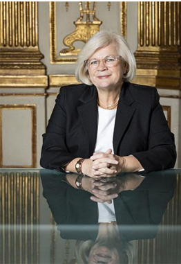
CATHERINE VAUTRIN, MINISTRE DU TRAVAIL, DE LA SANTÉ ET DES SOLIDARITÉS