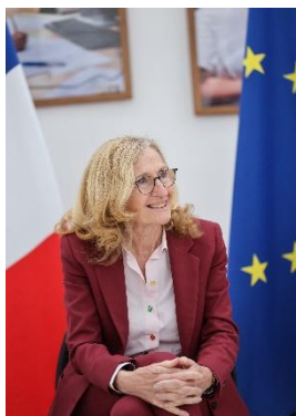
NICOLE BELLOUBET, MINISTRE DE L'ÉDUCATION NATIONALE ET DE LA JEUNESSE