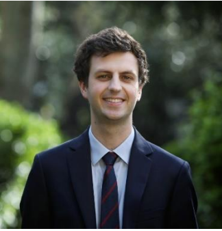
GEOFFROY DE VITRY, HAUT-COMMISSAIRE À L'ENSEIGNEMENT ET LA FORMATION PROFESSIONNELS