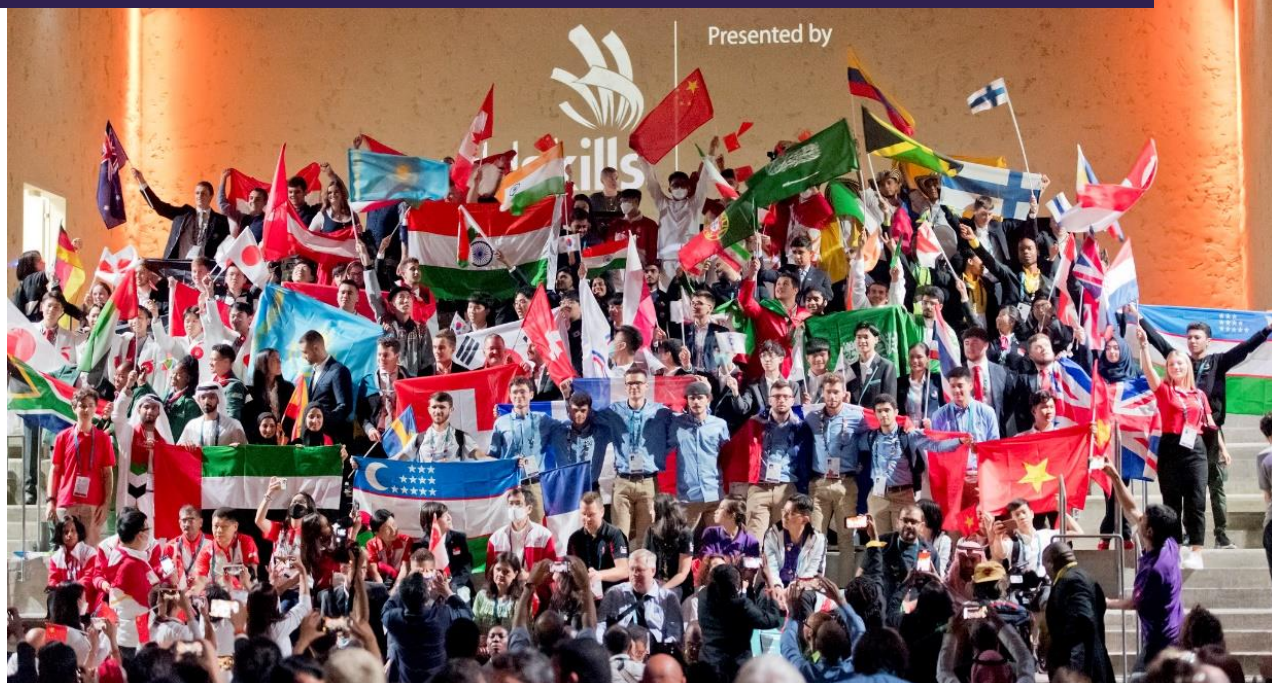
WorldSkills ©Laurent Bagnis

Le XIX e Sommet de la Francophonie, qui sera accueilli par la France, à Villers-Cotterêts et à Paris en octobre 2024, mettra en relief les défis d'une coopération économique renforcée, en particulier dans le cadre de « FrancoTech », salon des innovations francophones.