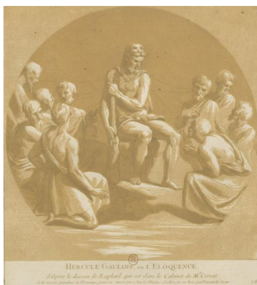
Vincent Le Sueur, Hercule Gaulois, ou L'Éloquence , d'après le dessin de Raphaël, estampe, 1729. Gallica BNF

Les premières décennies du XXI e siècle ont vu se développer largement, dans un certain nombre de pays occidentaux et plus particulièrement peut-être en France, un intérêt général pour des exercices de la parole jusque là réservés à des espaces particuliers. Cette aspiration générale s'incarne avec netteté dans la figure du vainqueur de joute oratoire, voire de l'orateur ou du tribun qui semble s'être multipliée ces dernières années au cinéma, en France et en Europe : Maître Périer dans le documentaire À voix haute (2016), le personnage fictif interprété par l'actrice Camilla Jordana dans le film Le Brio (2017), le Churchill « du sang, du labeur, des larmes et de la sueur » des Heures sombres (2017) : à compter du Discours d'un roi (2010), on constate une multiplication, dans des films très populaires, de ces figures modernes qui réactivent le modèle cher aux XVI e et XVII e siècles de l'Hercule Gaulois, dont la force passe par la langue et qui lie ses auditeurs à ses mots.