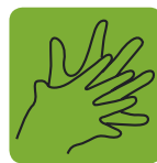
Frottez entre les doigts