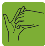
Frottez les ongles et le bout des doigts

Ce schéma pourra vous aider à expliquer les bons gestes du lavage de mains aux élèves.