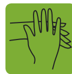
Frottez l'extérieur des mains